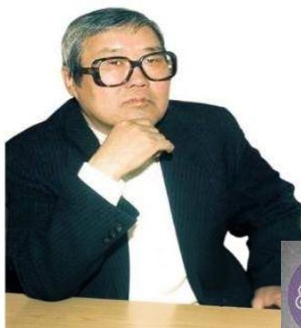
ИРДЫНЕЕВ ЮРИЙ ИРДЫНЕЕВИЧ

композитор, автор музыки гимна Республики Бурятия