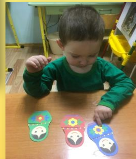
Д/и «Соедини в целое»