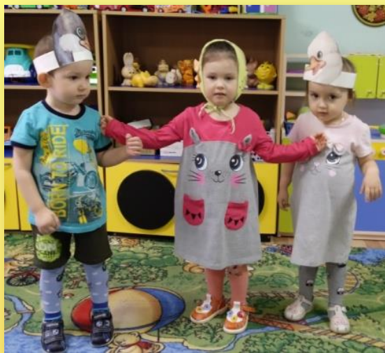
Инсценировка песенки «Два веселых гуся»