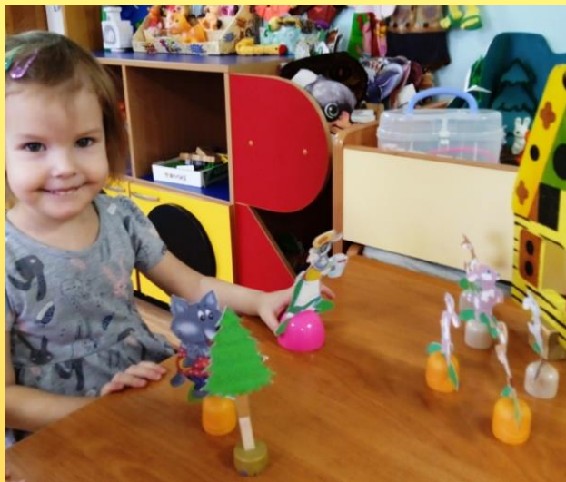
И/с «Эту сказку знаю я»