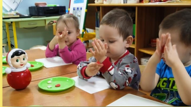
Лепка: «Вот какая у нас неваляшка»