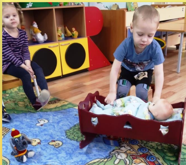
Исценирование потешки «Баю-бай, баю-бай, ты собачка, не лай».