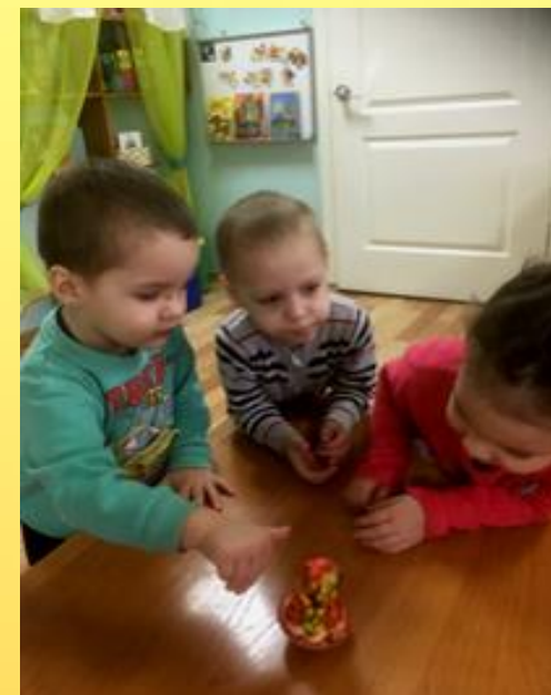
Игра-забава «Покрутили мы матрёшку, поиграли мы немножко!»