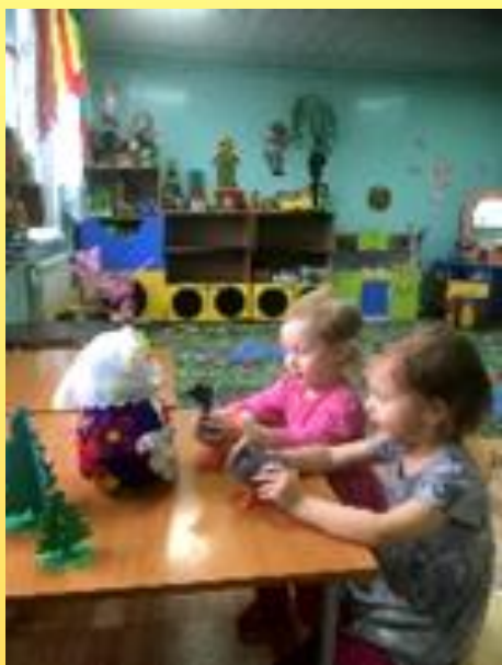
Игра «Жили у бабуся два весёлых гуся»