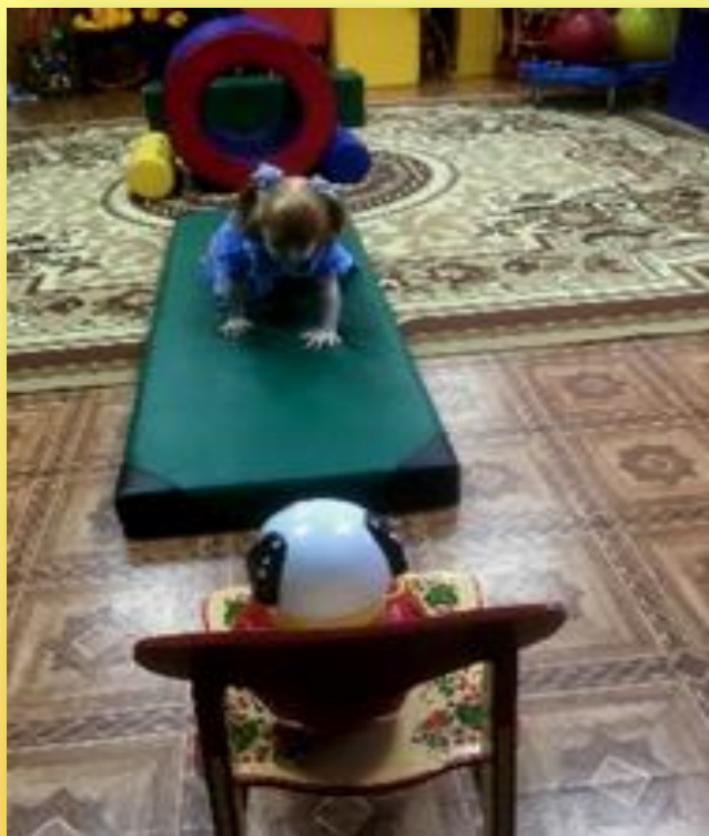
«В гости к неваляшке»