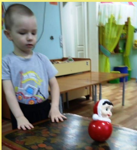
Знакомство с народной игрушкой -Неваляшка