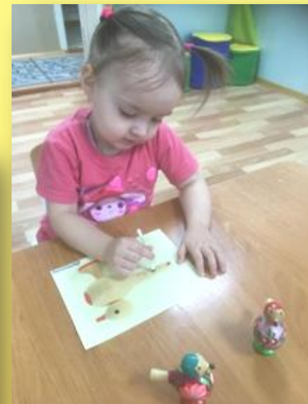
Рисование «Роспись свистульки»