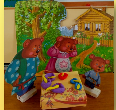
Лепка «Миски для 3 медведей»