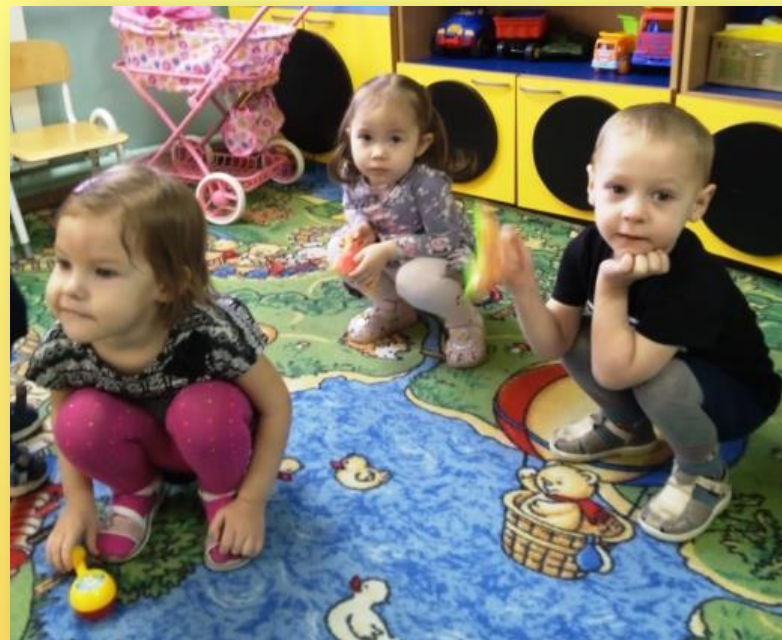
Динамическая пауза «3 медведя»