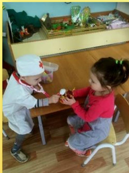
С/и ситуация «Матрёшка заболела»