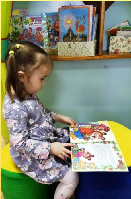
Рассматривание иллюстраций сказок.