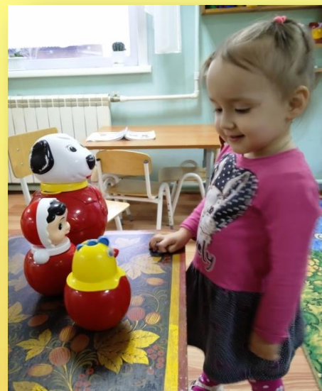
Д/и «Найди большую неваляшка»