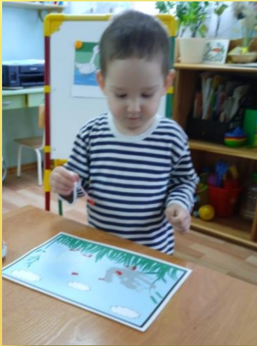
Рисование «Два веселых гуся»