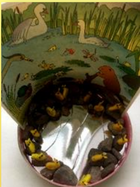
Лепка «Улитка, улитка, покажи рога»