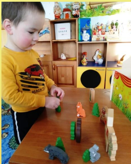
Рассказывание сказки «Колобок»