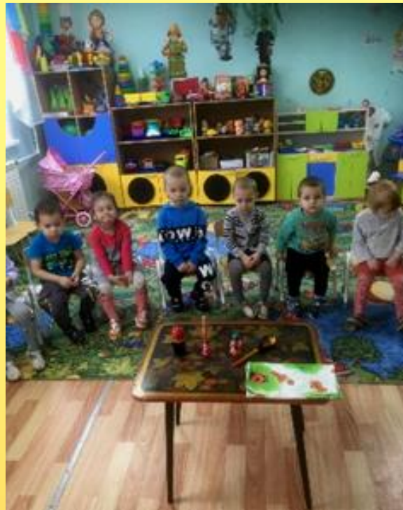
Д/и «Чего не стало?»