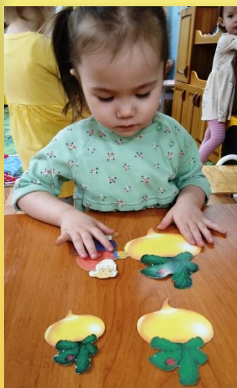
Д/и «Помоги деду найти большую репку»