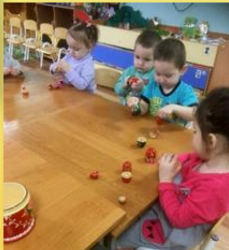
ФЭМП «Весёлые матрёшки»