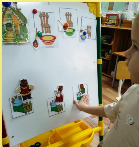
ФЭМП «Помоги медведям найти свои предметы»