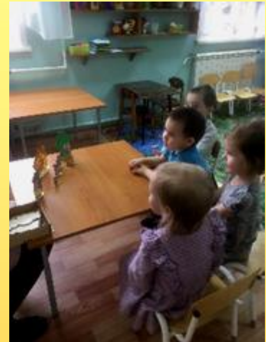
Рассказывание сказки «Теремок»