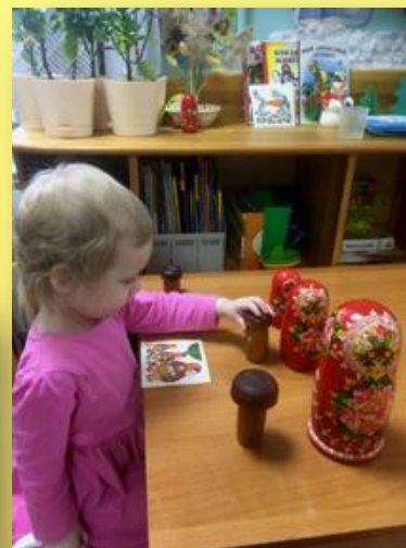
Д/и «За грибами»