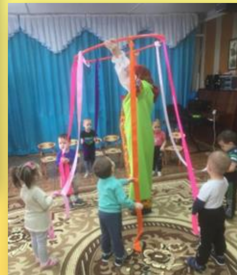
Развлечение «Гости к нам пришла матрёшка»