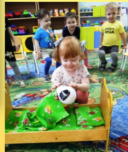
Экспериментальная деятельность «Уложим неваляшку спать»