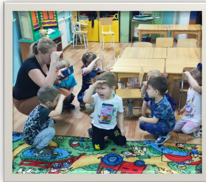
Физкультминутка «По дорожке»