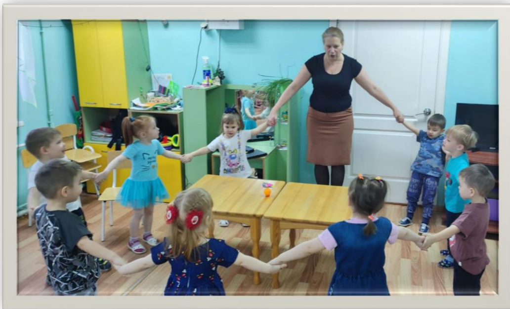
Игра «Надувайтесь пузырь»