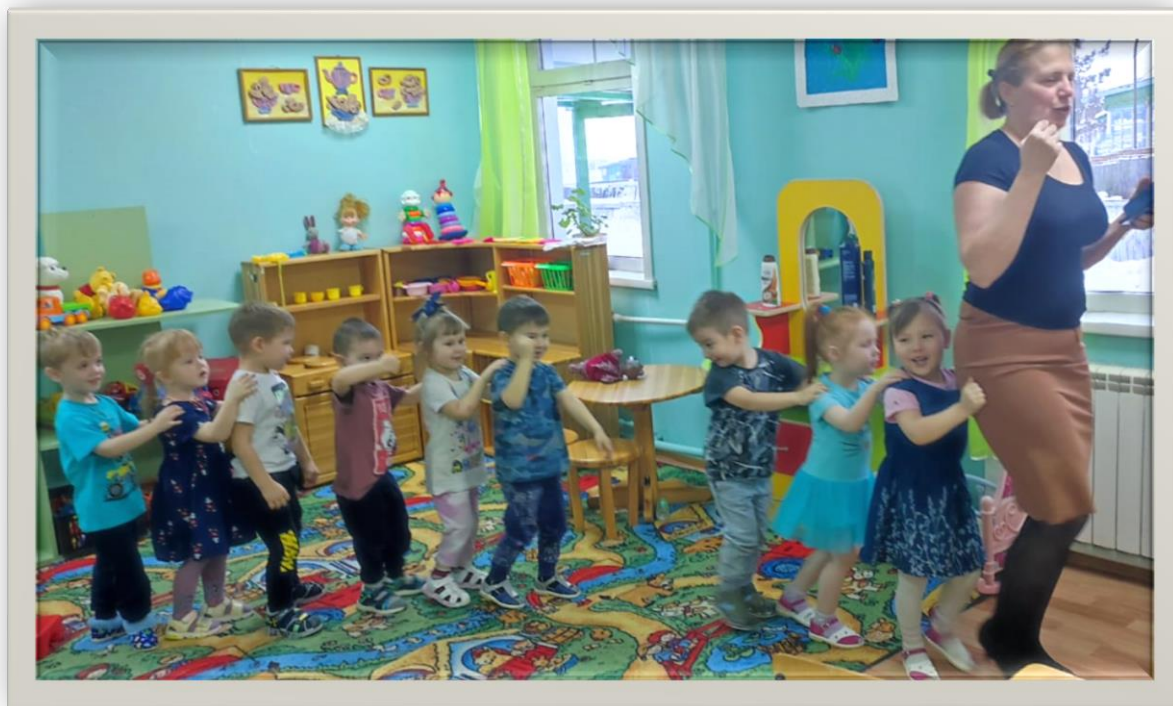
Музыкальная игра «Чух-чух паровозик»