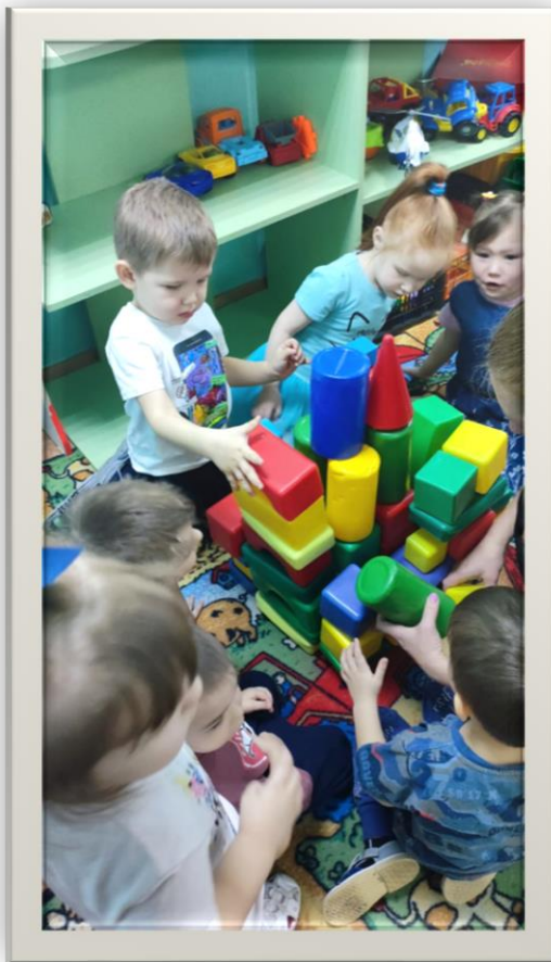
Строим теремок .