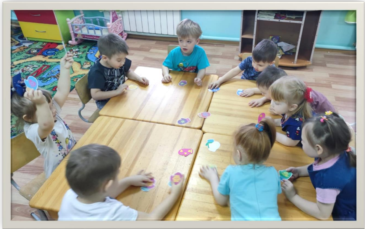
Игра «Найди пару варежке»