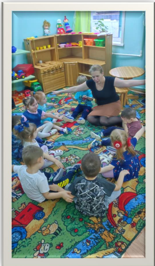
Летим на ковре-самолете.