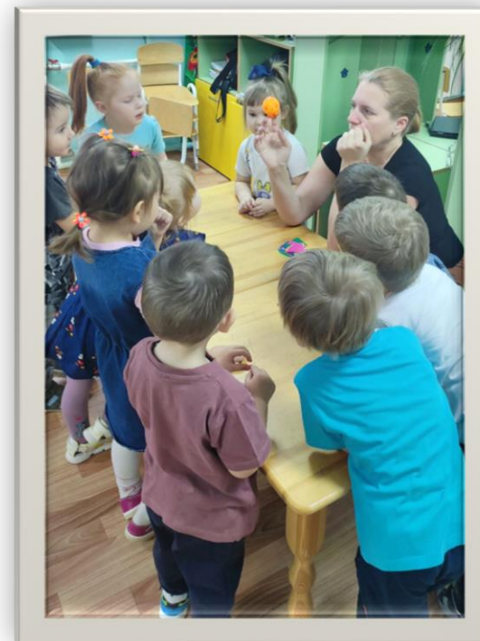
В гостях у колобка