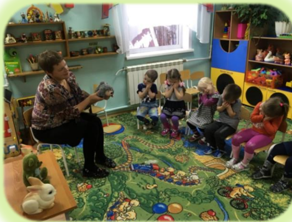
Сказки. Задание «Угадай сказку»