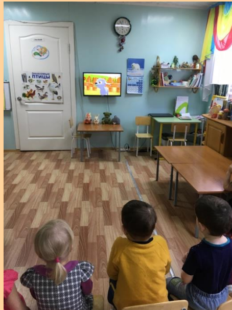
Колыбельная песенка «Баю – баюшки – баю».