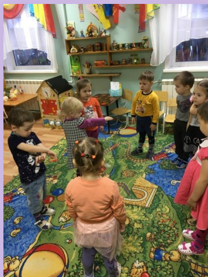
Народная игра «Перетягивание каната»